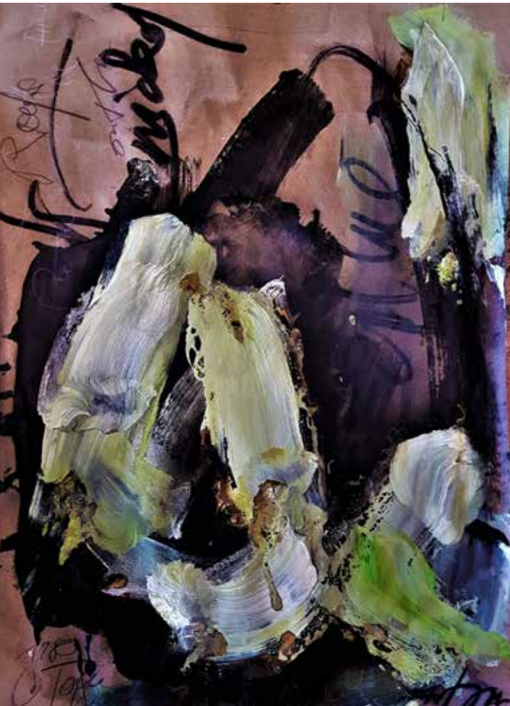
Bild oben links: Serie «Roots»: Tom Waits «On the Nickel» / Draft 1